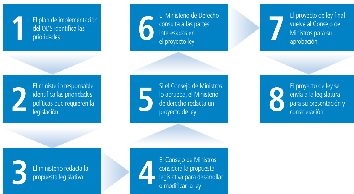
Figura 1 : Proceso general para elaborar o modificar las leyes

Consejo Las áreas de reforma legislativa que pueden ser necesarias para implementar el Objetivo 16 incluyen: las disposiciones de derecho penal para procesar el tráfico de personas (Objetivo 16.2); las disposiciones penales para castigar el soborno y la corrupción, de acuerdo con el Capítulo 3 de la CNUCC (Objetivo 16.5); la legislación y la normativa de transparencia y rendición de cuentas de la gestión financiera (Objetivo 16.6); las políticas que requieren la consulta con los ciudadanos en la toma de decisiones (Objetivo 16.7); la legislación de libertad de información (FOI) (Objetivo 16.10); y la legislación contra la discriminación (Objetivo 16.b de los MOI).