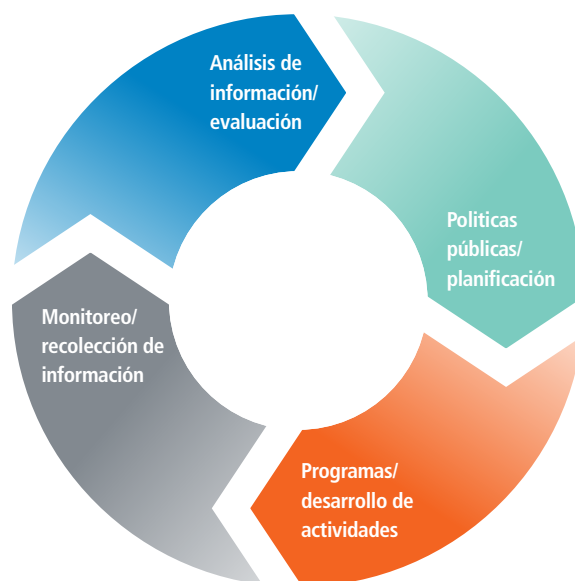
Figura 3: Ciclo Nacional de Monitoreo