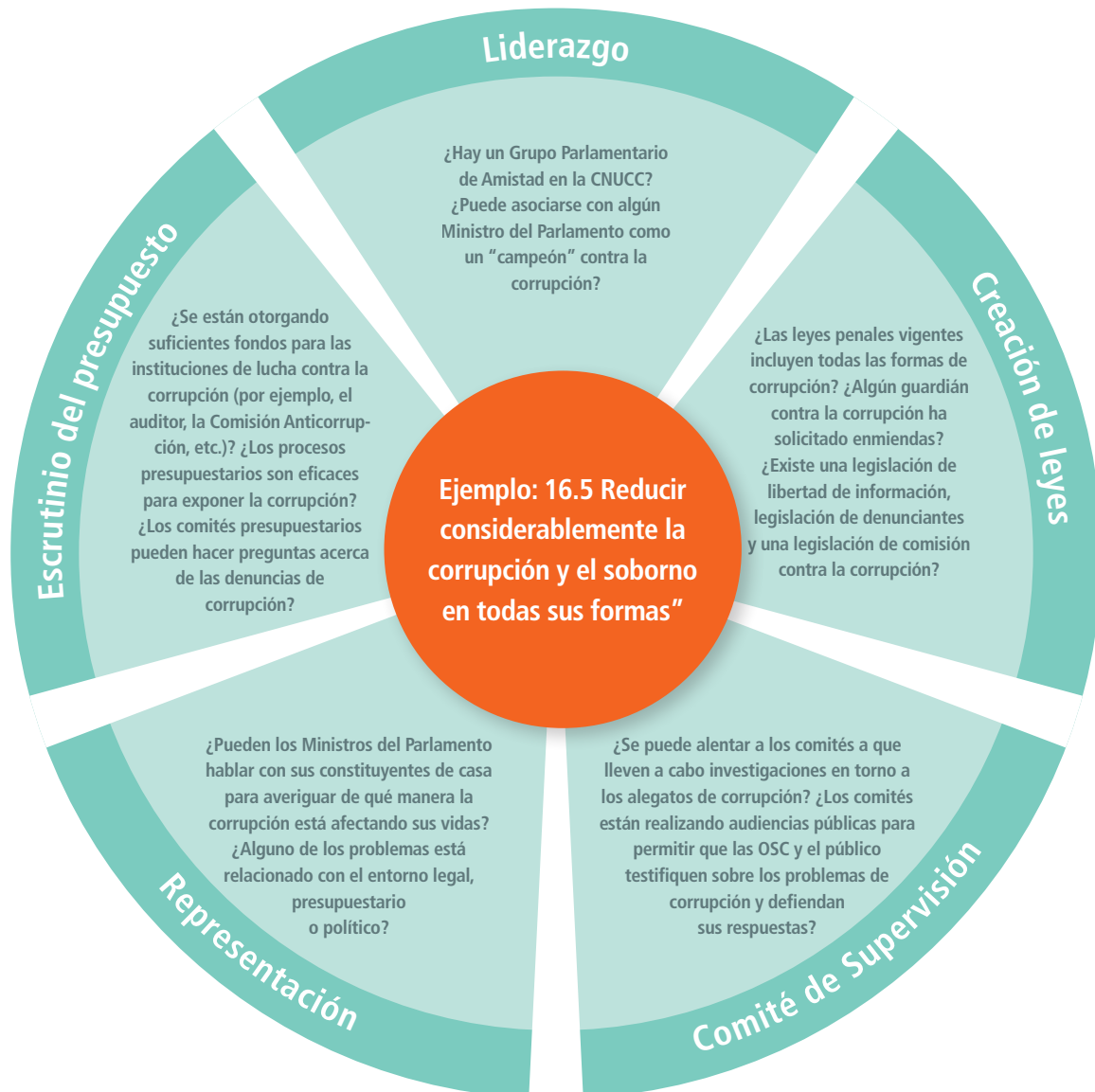
Figura 1: Puntos de entrada para trabajar con los legisladores

Aunque la rama ejecutiva generalmente elabora las leyes y enmiendas, en muchos países, los miembros de la legislatura también pueden proponer sus propias leyes (ya sea debido a que el congreso o asamblea tiene sus propios poderes legislativos o a través de los proyectos de ley de los miembros privados). Cuando esto sea posible, también se podría alentar a legisladores individuales y/o coaliciones de legisladores individuales a que desarrollen proyectos de ley. Cuando los legisladores que están dispuestos a patrocinar una ley o enmienda se identifican, la sociedad civil puede proporcionarles asistencia técnica para elaborar un proyecto de ley. En el Reino Unido, por ejemplo, los prim-