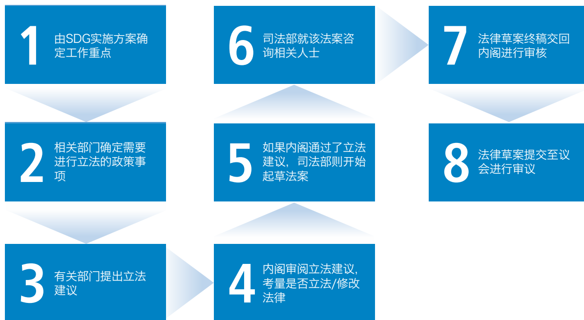
表1：起草或修改法律的一般程序